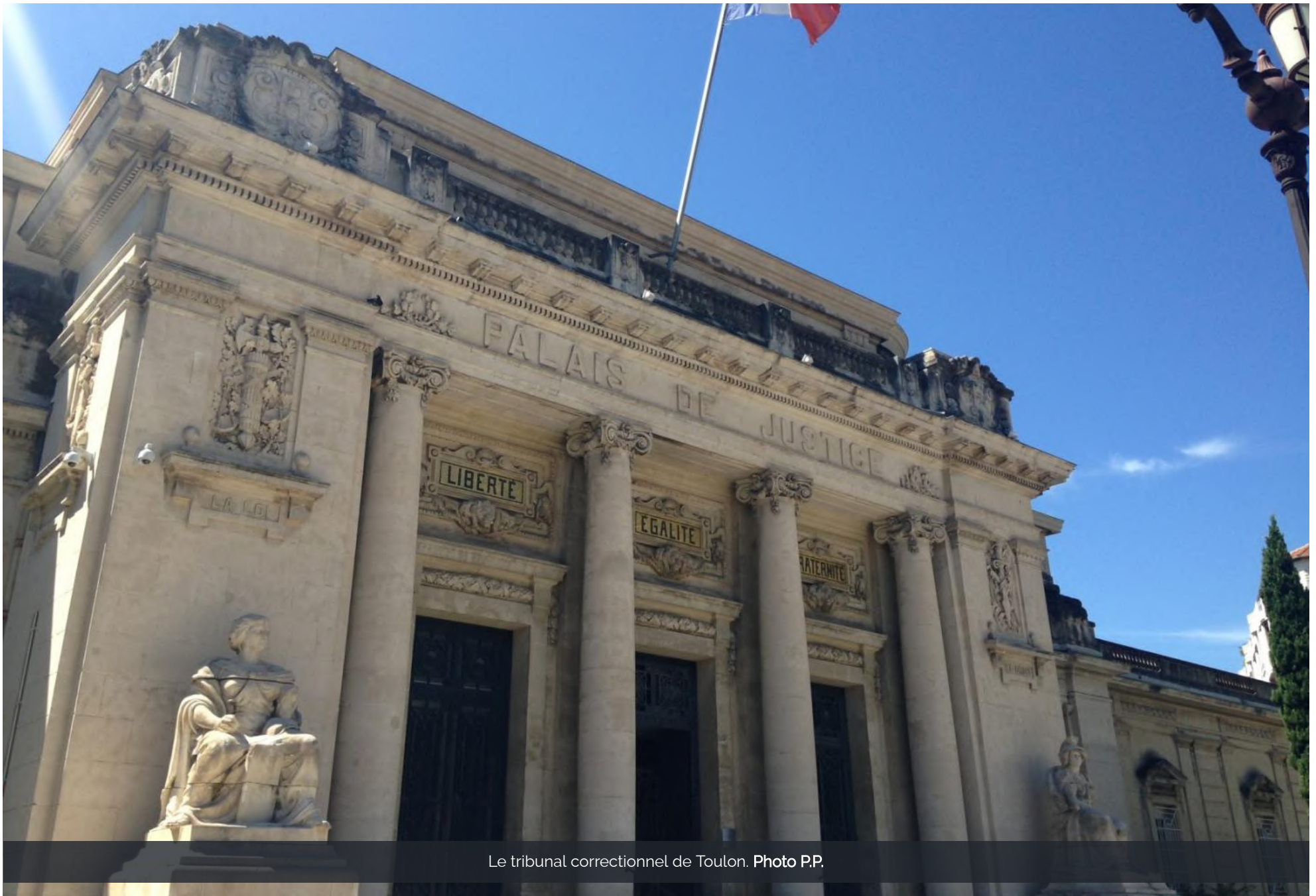
Le tribunal correctionnel de Toulon.